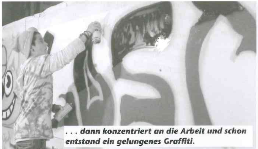
. . . dann konzentriert an die Arbeit und schon entstand ein gelungenes Graffiti.